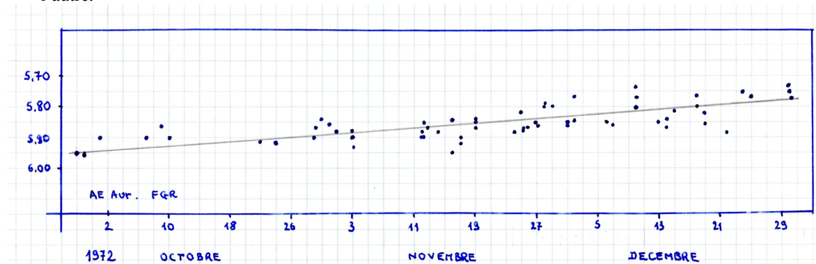
Figure 3 : Observations de FGR en 1972. On note une régulière augmentation de l'éclat apparent de l'étoile de la magnitude 5.95 à 5.78. Autour de cette moyenne qui monte, on peut imaginer une légère ondulation d'amplitude 0.20 mag.